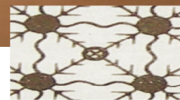
molecola atomo impasto bioceramico al microscopio elettronico

ENERGIA, VIBRAZIONE e RISONANZA mediante irraggiamento dell'Infrarosso Lontano